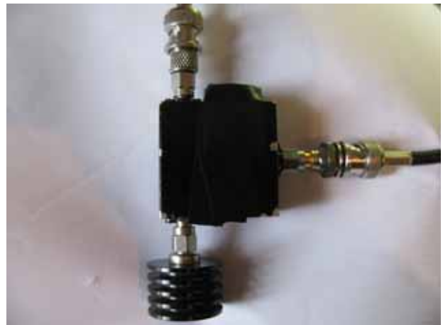
on immobilise avec de l'araldite